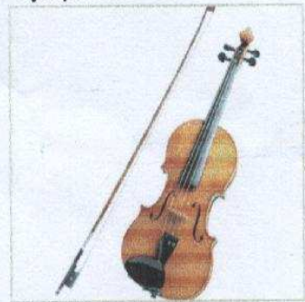
Violon et son archet en oris de cheval

Sa composition prend place entre sa troisième et sa quatrième symphonie et est contemporaine de celle de son quatrième concerto pour piano. C'est une des œuvres les plus tendres qu'il ait composées car expression d'un rare moment de bonheur qu'il vécut dans sa vie: il se fiançait (secrètement) avec Thérèse de Brunswick et le caractère calme et heureux de l'œuvre correspondait à ce que ressentait Beethoven à ce moment. Il ne reprendra plus par la suite cette forme musicale. Le dédicataire en est Franz Clément, directeur d'orchestre du Theater an der Wien et violoniste célèbre à l'époque, qui avait commandé l'œuvre pour des concerts de Noël. La première a lieu le 23 décembre 1806 à ce même théâtre. Elle ne fut guère jouée du vivant du musicien, les auditeurs la trouvant assez peu virtuose, le thème trop souvent répété (40 fois), le violon étant très peu présent voire sous-exploité par rapport aux concertos de Niccolò Paganini.